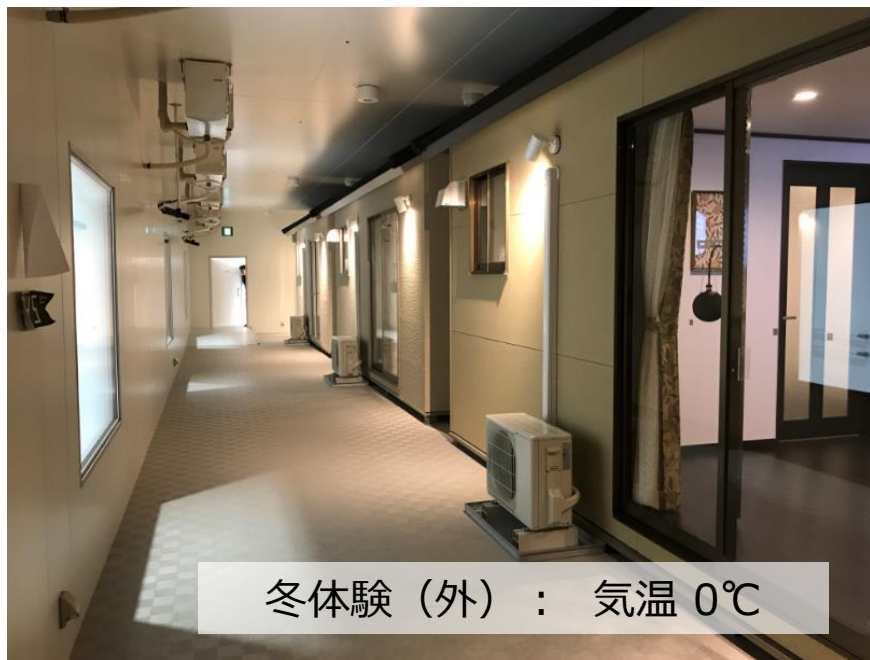
冬体験（外）： 気温 0℃