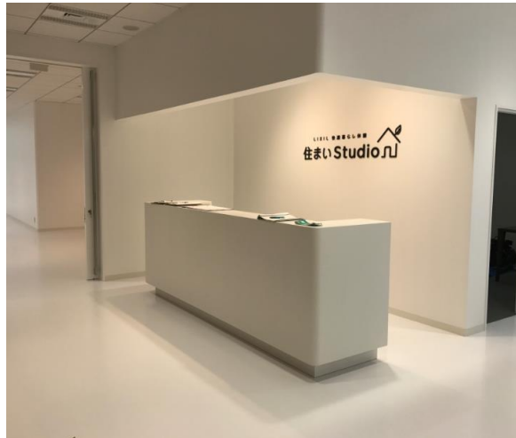
エントランス (受付)